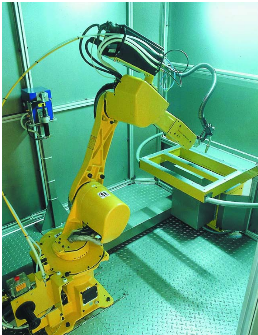
Figura 2 - Sistemas Weldpro (2)